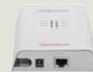
Nätverksuttag i medieomvandlare Obs! Kontrollera att medieomvandlaren är ansluten till ett eluttag.